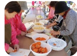
カレーパーティー