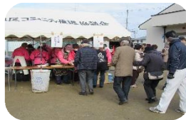
ぜんざいのふるまい

しめ縄や正月飾りに点火、無事息災を祈ります。ぜんざい・お神酒もふるまいます。同時に自主防災訓練や献血もしています。グラウンドでは「じてんしゃ」の催しもあります 中央公園サブグラウンド 令和4年1月9日(日)予定