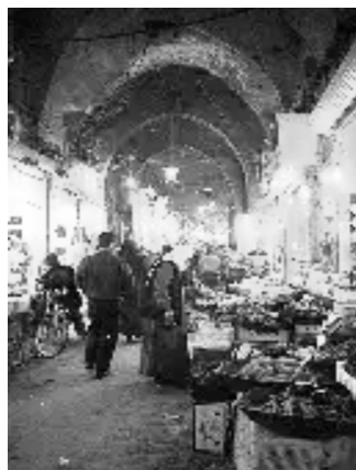
アレッポのスーク

シリアの北に位置するアレッポは、シリア内戦の反政府軍の拠点として知れるようになりましたが、首都ダマスカスに次いで第二の都市として栄えていました。